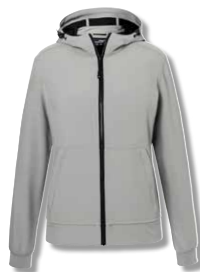
Veste softshell à capuche au look sportif