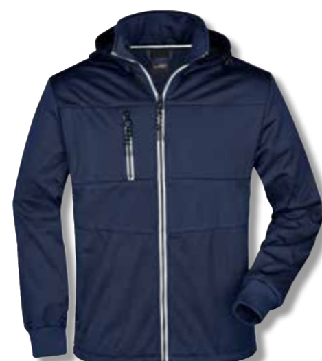
Veste softshell avec détails tendance