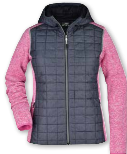
Veste hybride avec tricot polaire en mix de tissus